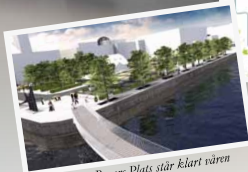
P-buset under Bagers Plats står klart våren 2012.