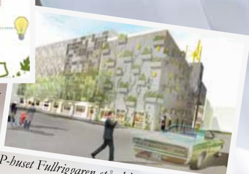
P-buset Fullriggaren står klart våren 2012.

P-buset Fullriggaren presenterades på Expo 2010 i Shanghai med anledning av den stora satsningen på miljö och hållbarhet!